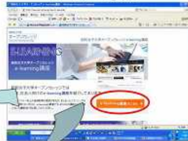
昭和女子大学オープンカレッジ e-learning講座