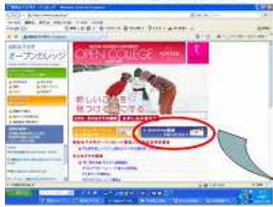
【昭和女子大学オープンカレッジHP】