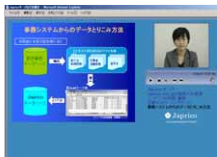
Japricoダウンロード用講義イメージ

Japricoサイト上にダウンロードのためのダウンロード科目を設けてあります。その手順に従って、ダウンロードをしてください。