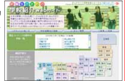
トップページ画面(一部構成変更の場合があります)